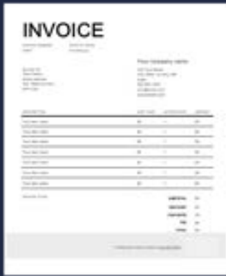
فاتورة مصدرة من برنامج تحرير نصوص